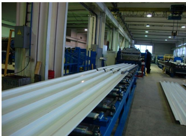
Линия пластического профилирования ЛПРФ200 (С – series).